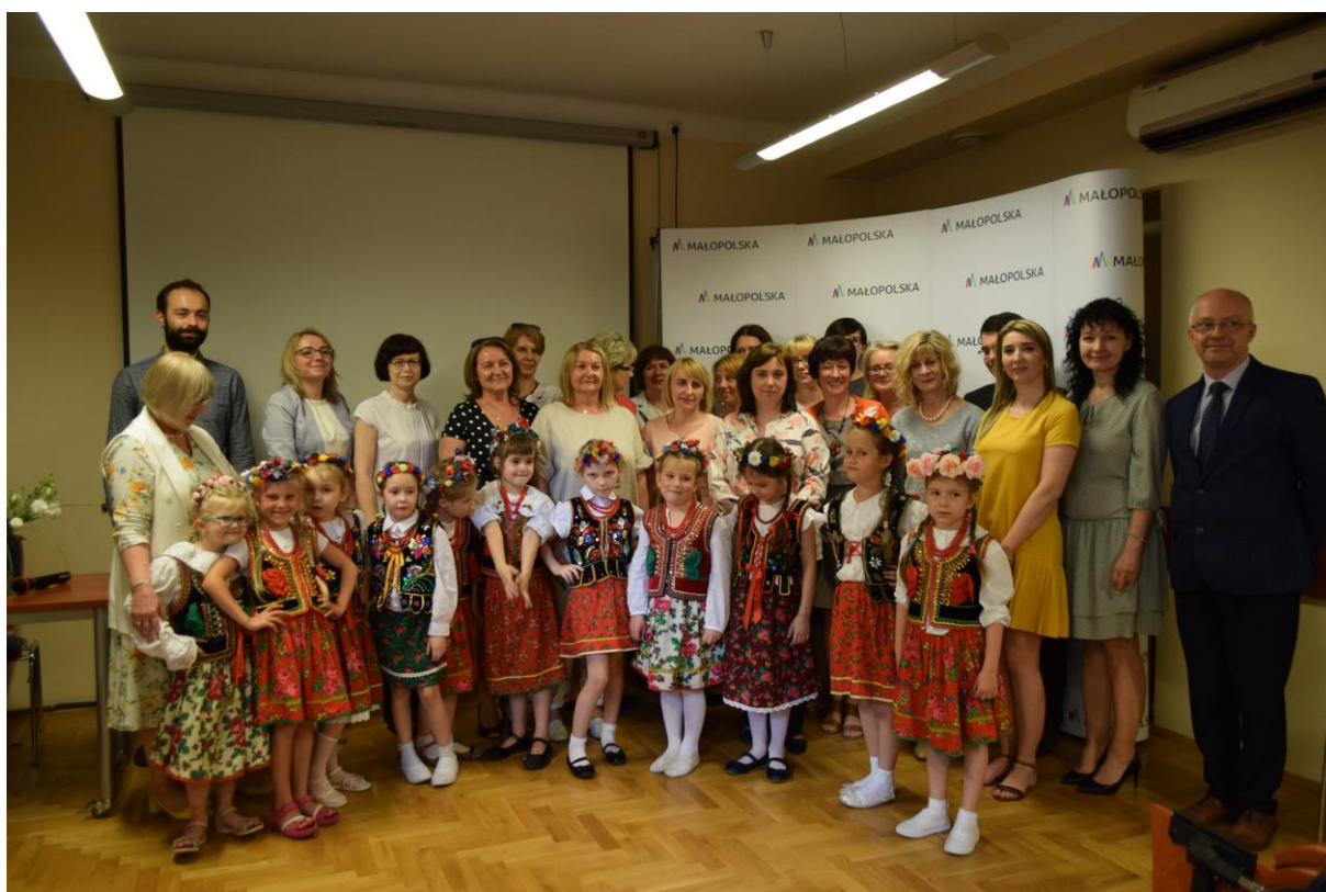
Nauczyciele – laureaci X edycji konkursu, dyrektorzy przedszkoli i szkół

Uczestnictwo w konkursie „Kreatywny Nauczyciel” jest cenną okazją do upowszechniania przykładów dobrej praktyki pedagogicznej, zintegrowania środowiska nauczycieli i jego aktywizacji oraz przyczynia się do podnoszenia jakości kształcenia w małopolskich placówkach edukacyjnych. Konkurs promuje twórczych, innowacyjnych nauczycieli, którzy są zainteresowani dalszym rozwojem własnego warsztatu pracy. Nagrody, które trafiają w ręce laureatów konkursu to nie tylko wyróżnienie, ale przede wszystkim docenienie ich trudu i oddania w codziennej pracy.